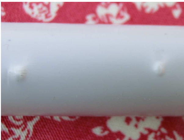
ohne Zwischenholz gebohrt