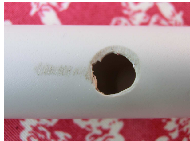
zu schnell gebohrt, schlecht gefast